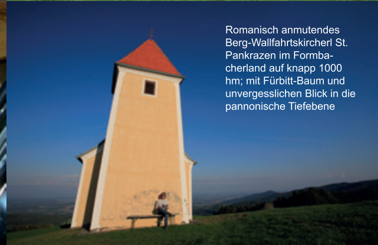
Romanisch anmutendes Berg-Wallfahrtskircherl St. Pankrazen im Formbacherland auf knapp 1000 hm; mit Fürbitt-Baum und unvergesslichen Blick in die pannonische Tiefebene