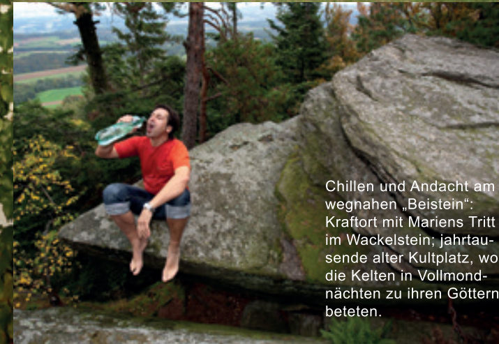
Chillen und Andacht am wegnahen „Beistein“: Kraftort mit Mariens Tritt im Wackelstein; jahrtausende alter Kultplatz, wo die Kelten in Vollmondnächten zu ihren Göttern beteten.