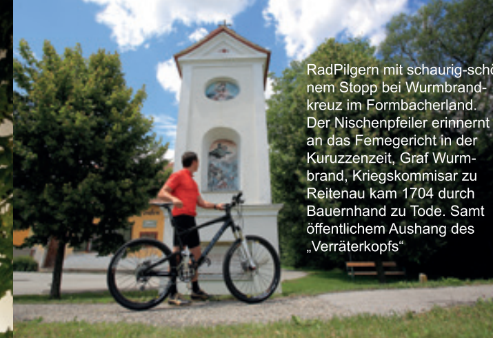
RadPilgern mit schaurig-schönem Stopp bei Wurmbrandkreuz im Formbacherland. Der Nischenpfeiler erinnert an das Femegericht in der Kuruzzenzeit. Graf Wurmbrand, Kriegskommissar zu Reitenau kam 1704 durch Bauernhand zu Tode. Samt öffentlichem Aushang des „Verräterkopfs“