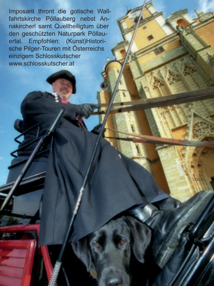
Imposant thront die gotische Wallfahrtskirche Pöllauberg nebst Annakircherl samt Quellheiligtum über den geschützten Naturpark Pöllauertal. Empfohlen: (Kunst)Historische Pilger-Touren mit Österreichs einzigem Schlosskutscher www.schlosskutscher.at