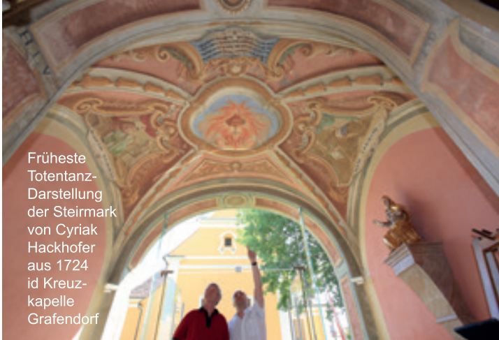
Früheste Totentanz- Darstellung der Steiermark von Cyriak Hackhofer aus 1724 id Kreuz- kapelle Grafendorf