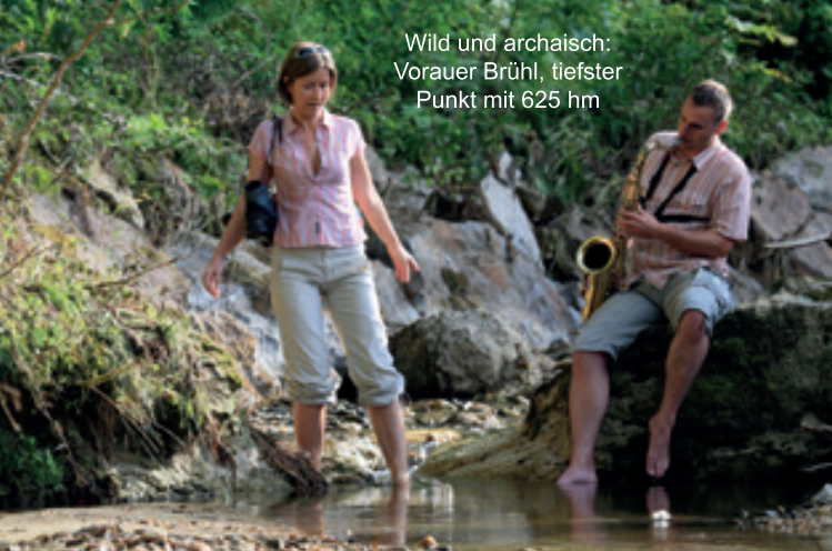
Wild und archaisch: Vorauer Brühl, tiefster Punkt mit 625 hm