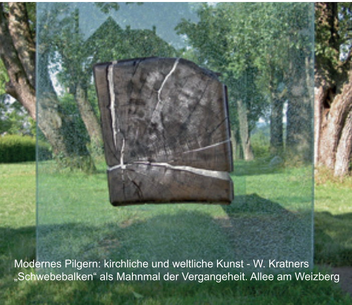
Modernes Pilgern: kirchliche und weltliche Kunst - W. Kratners „Schwebebalken“ als Mahnmal der Vergangeheit. Allee am Weizberg