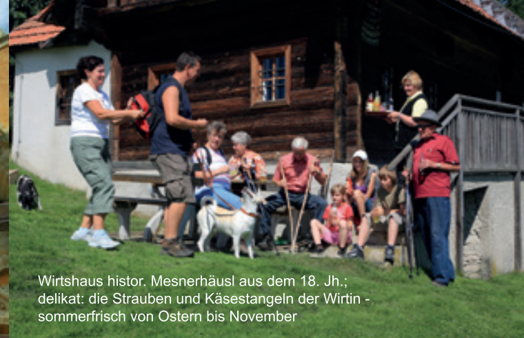
Wirtshaus histor. Mesnerhäusl aus dem 18. Jh.; delikat: die Strauben und Käsestangeln der Wirtin - sommerfrisch von Ostern bis November