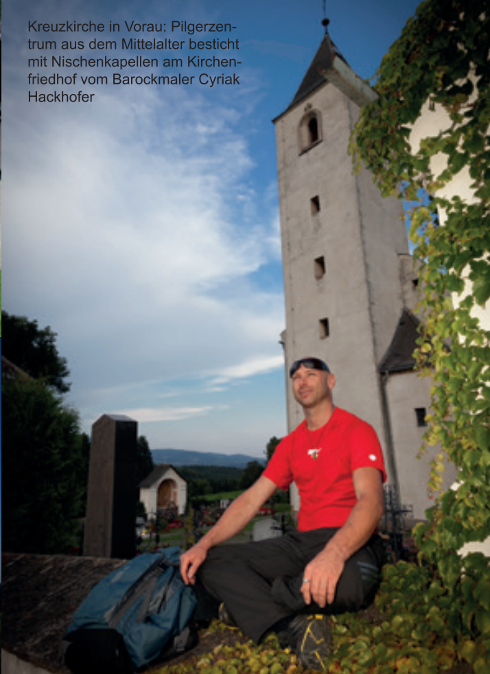
Kreuzkirche in Vrau: Pilgerzentrum aus dem Mittelalter besticht mit Nischenkapellen am Kirchenfriedhof vom Barockmaler Cyriak Hackhofer