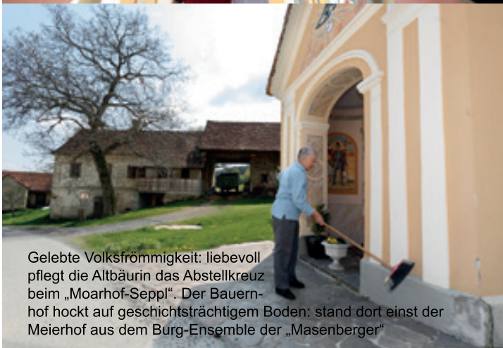
Gelebte Volksfrömmigkeit: liebevoll pflegt die Altbäurin das Abstellkreuz beim „Moarhof-Seppin“. Der Bauernhof hockt auf geschichtsträchtigen Boden: stand dort einst der Meierhof aus dem Burg-Ensemble der „Masenberger“