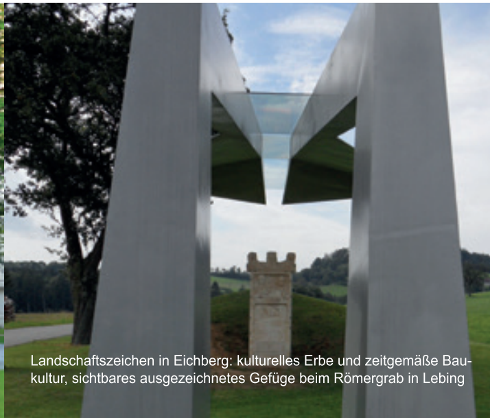
Landschaftszeichen in Eichberg: kulturelles Erbe und zeitgemäße Baukultur, sichtbares ausgezeichnetes Gefüge beim Römergrab in Lebing

Verordnung der Steiermärk. Landesregierung aus 1979: Das Gebiet wird wegen seiner besonderen landschaftlichen Schönheit und Eigenart, seiner seltenen Charakteristik und seines Erholungswertes zum Landschaftsschutzgebiet erklärt.