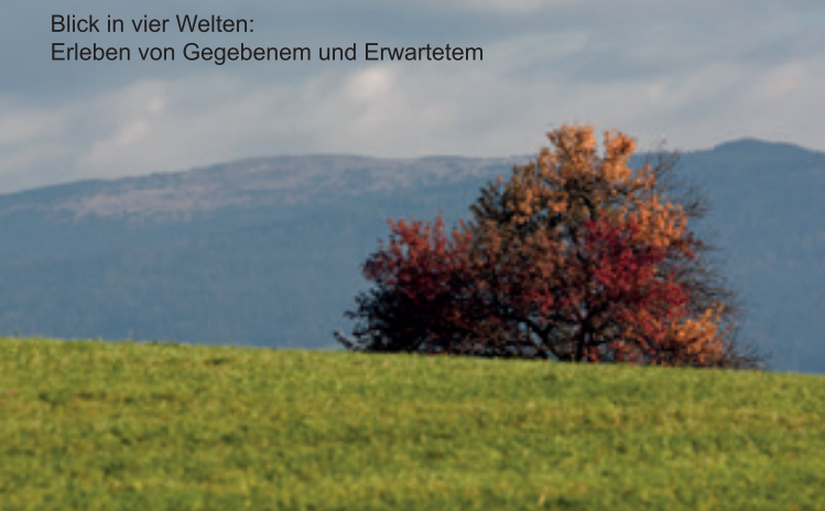
Blick in vier Welten: Erleben von Gegebenem und Erwartetem