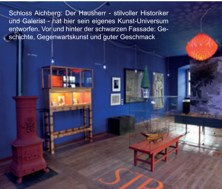
Schloss Aichberg: Der Hausherr - stilvoller Historiker und Galerist - hat hier sein eigenes Kunst-Universum entworfen. Vor und hinter der schwarzen Fassade: Geschichte, Gegenwartskunst und guter Geschmack