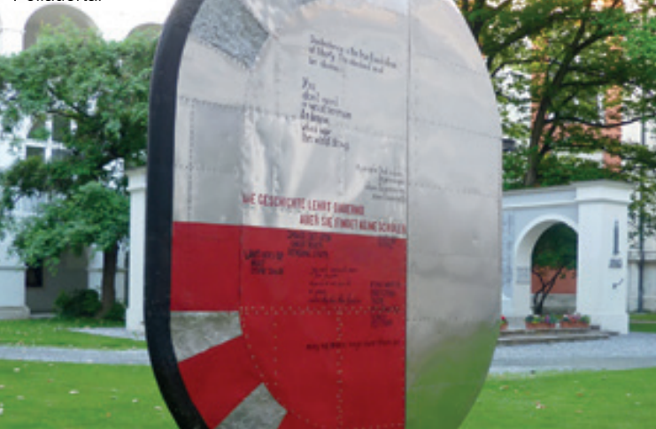
Liberation-Marker: Kunstwerk-Denkmal im Naturpark Pöllauertal